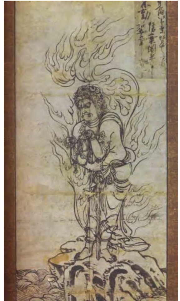
Fudo Myoo (Shinkai)

In diesem Sinne veranstalten wir traditionell dieses Fest nach dem Motto: „gemeinsam trainieren, gemeinsam Essen“ um ein glückliches und erfolgreiches Neues Jahr einzuleiten.